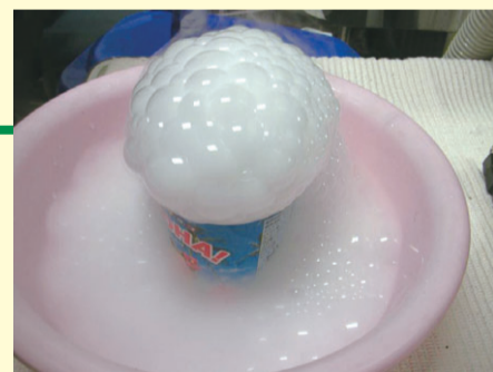
ドライアイスとシャボン玉の実験