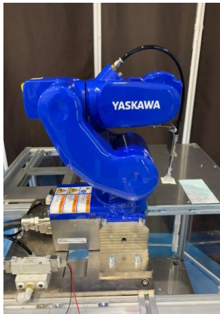
①ハンドリングロボット(安川電機) 超小型ロボット可搬500g ラベル等軽量ワークの搬送。

実機を用いて、各種アイテムの自動化事例を紹介し、製造現場の自動化のポイントを説明します。