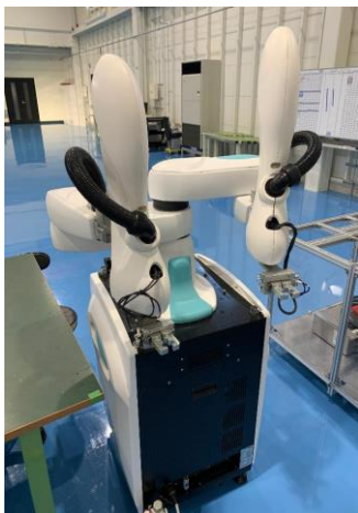
③双腕スカラロボット(川崎重工業) duAro 可搬2kg (1アーム) 協働型ロボットで安全柵 不要キャスター付きなので移動可能。