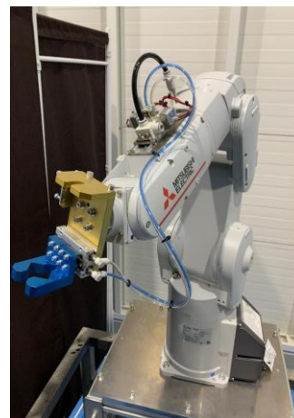
④ハンドリングロボット(三菱電機) MELFA RV-4FR 可搬4kg 現在市場に多く採用される ハンドリングロボットで汎用性に優れる。