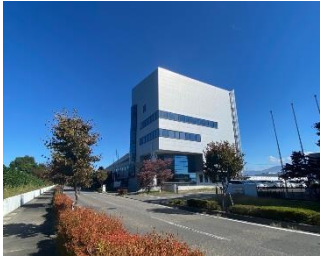
情報創造館庁舎5階